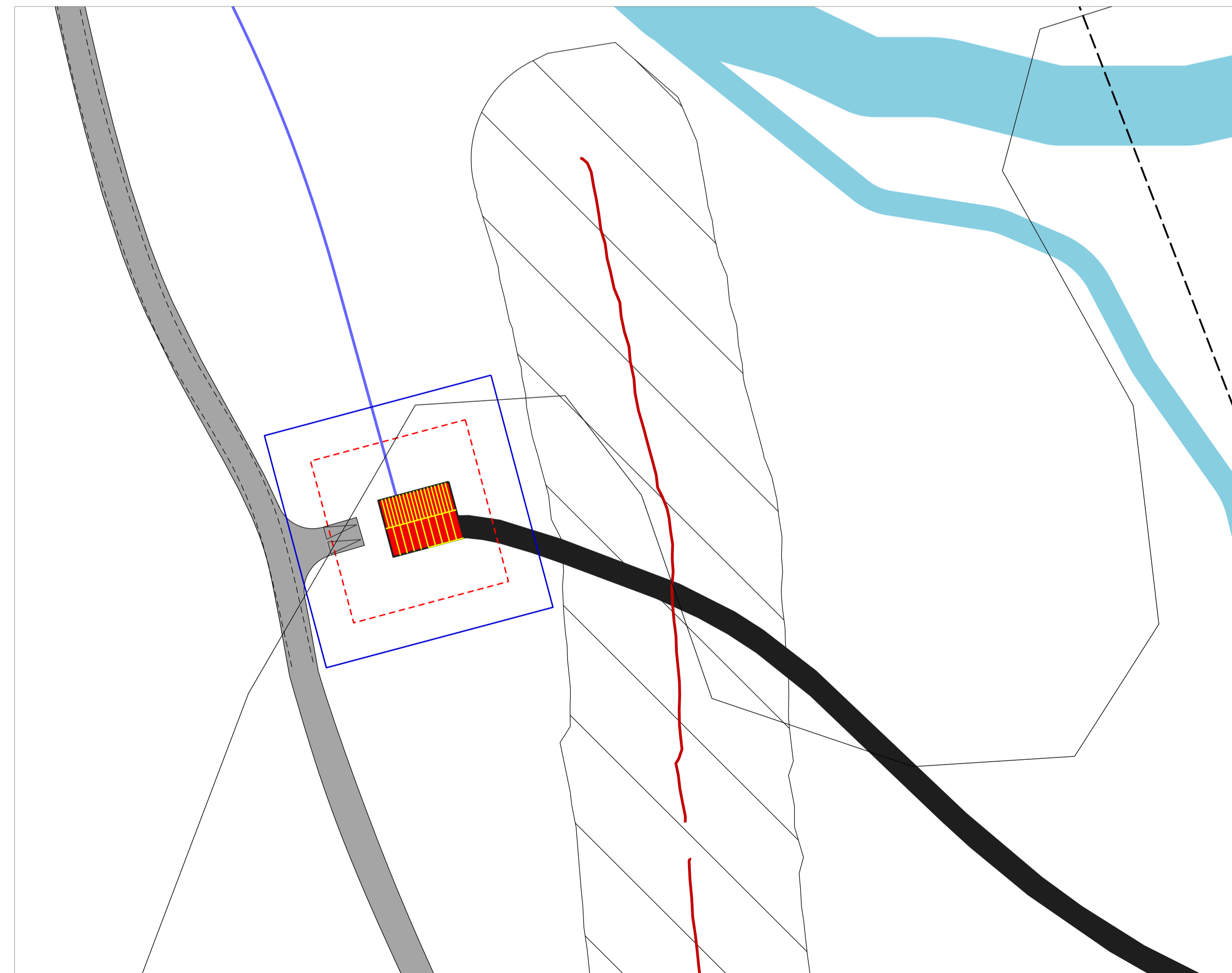
Stöðvarhús, mvk. 1:500