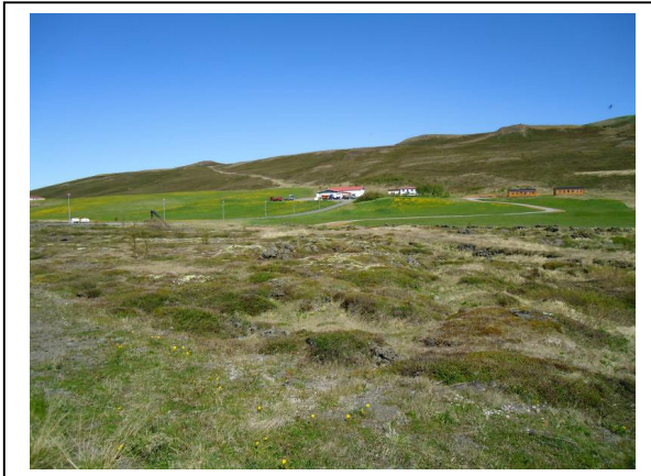
Brekka, séð frá suðvestri.

Meðal afgerandi atriða er að gerð íbúðarhúsa á svæðinu taki mið af landhalla, útsýnisáttum og birtu.