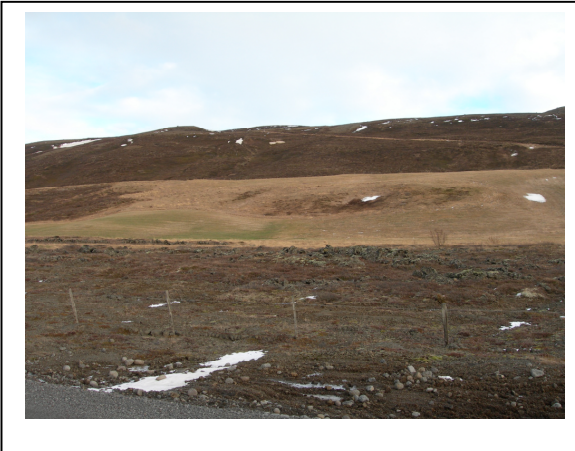
Brekka, séð upp á íbúðarsvæðið.

staðhættum og landslagi. Svæðið hallar á móti suðvestri, landhalli er allt að 10%, þar sem hann er mestur.