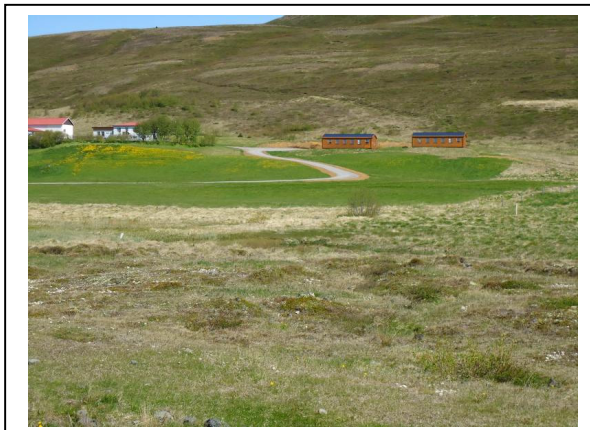
Brekka, séð frá vegi.

Reglum um aðgengi fatlaðra, á ákvæðum veitustofnana svo og öllum almennum ákvæðum er varða tímamörk og tryggingar. Ekki eru settar sérstakar kvaðir á umferð þar sem götur liggja í gegnum lóðir, aðrar en áður eru nefndar í kafla 3.2.2. Reksraraðili, sem jafnframt er eigandi lóða, mun hafa yfirumsjón með þessum þætti á svæðinu.