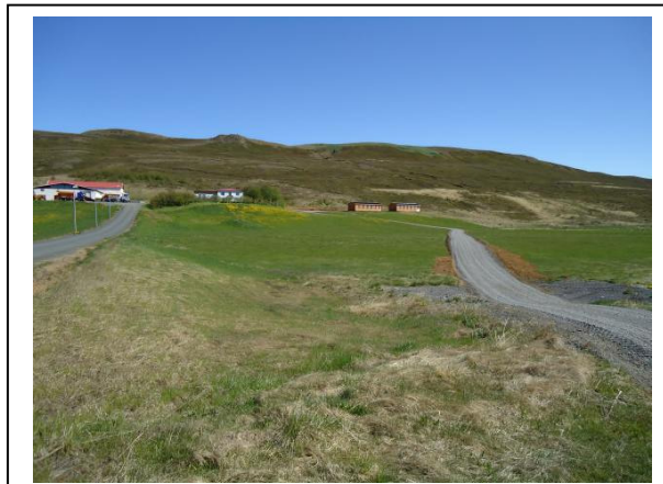
Brekka, séð yfir hluta ferðaþjónustusvæðisins.

Þannig eru lóðir skilgreindar á svæði-B, en svæðið í heild er nýtt til ferðaþjónustu, utan íbúðarhússlóðar.