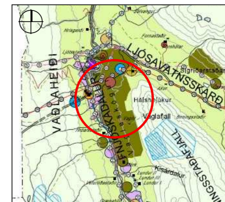
ÁÐALSKIPULAG ÞINGEYJARSVEITAR 2010-2022 SVEITARFÉLAGSUPPRÁTTUR

SAMÞYKKT DEILISKIPULAGSBREYTINGARINNAR VAR AUGLÝST Í B-DEILD STJÓRNARTÍÐINDA ÞANN _____