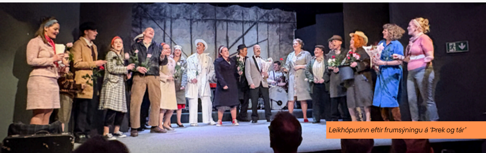
Leikhópurinn eftir frumsýningu á 'Þrek og tár'

Samfélag verður ekki samfélag nema íbúar taki þátt. Og hvað á ég að gera í því? Komdu með, vertu með, taktu þátt, sýndu stuðning – vertu partur af okkur. Því þetta er ekki sjálfgefið. Og svo er líka kannski hægt að sækja um styrk!